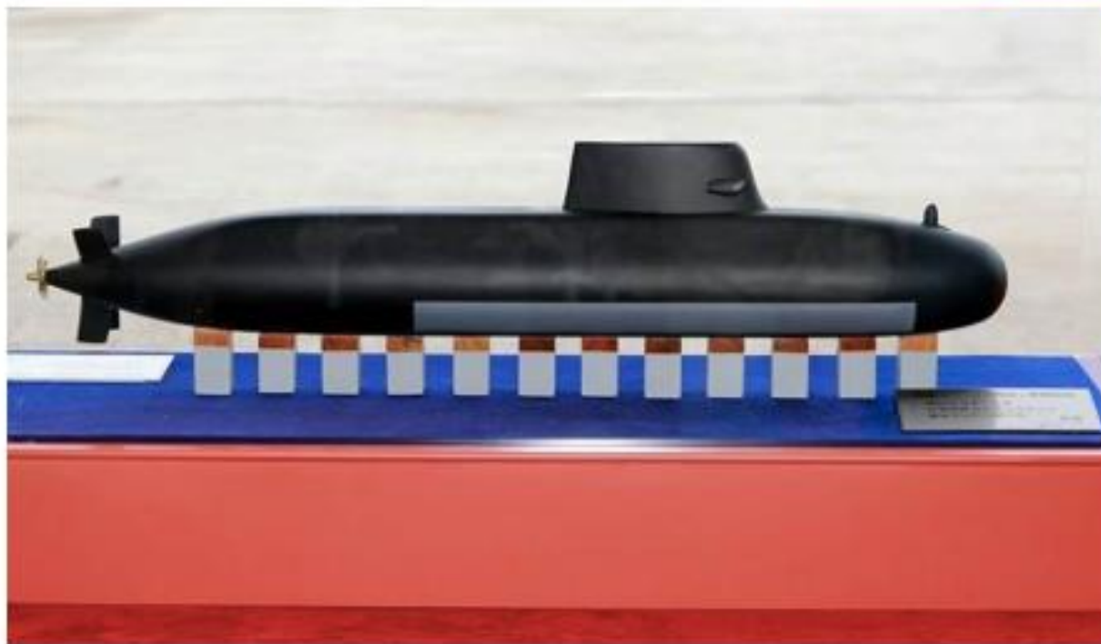
蔡英文總統2019年5月9日主持海軍「潛艦國造」專用廠房動土典禮，現場首度公開國造X型尾舵潛艦構型。