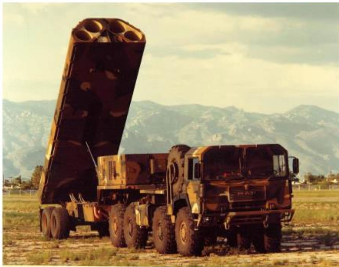
美國陸軍車載型陸基巡航導彈。