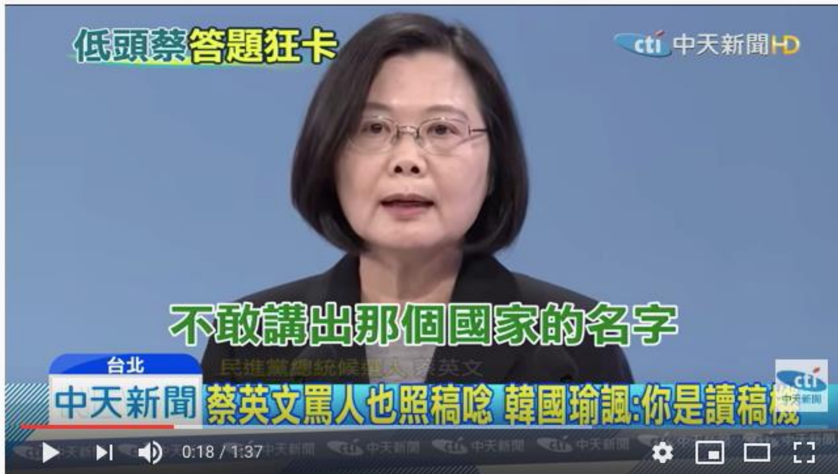
20191229中天新聞 蔡英文罵人也照稿唸 韓國瑜諷：你是讀稿機