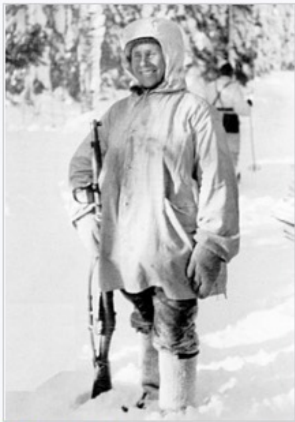
Simo Häyhä , the legendary Finnish sniper, known as "the White Death" by Soviets.