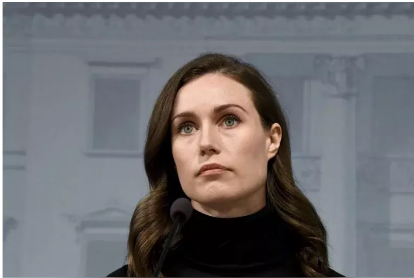
芬蘭總理馬林。