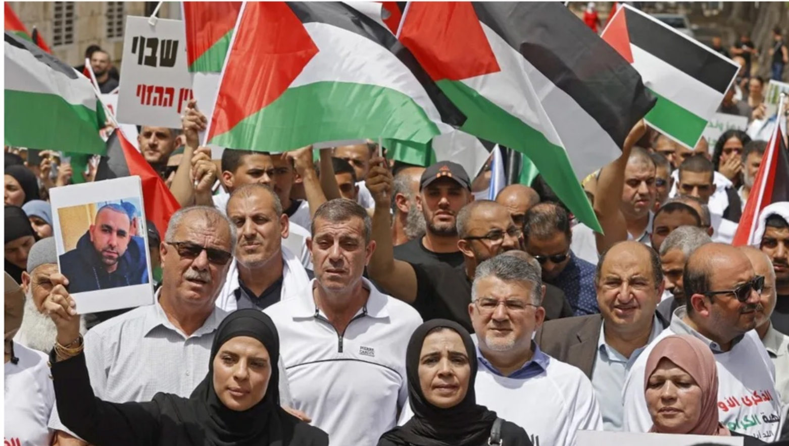
Arab Israelis rally with Palestinian flags in the mixed city of Lod near Tel Aviv on May 13, 2022, a year after a member of their community was killed during intercommunal violence.