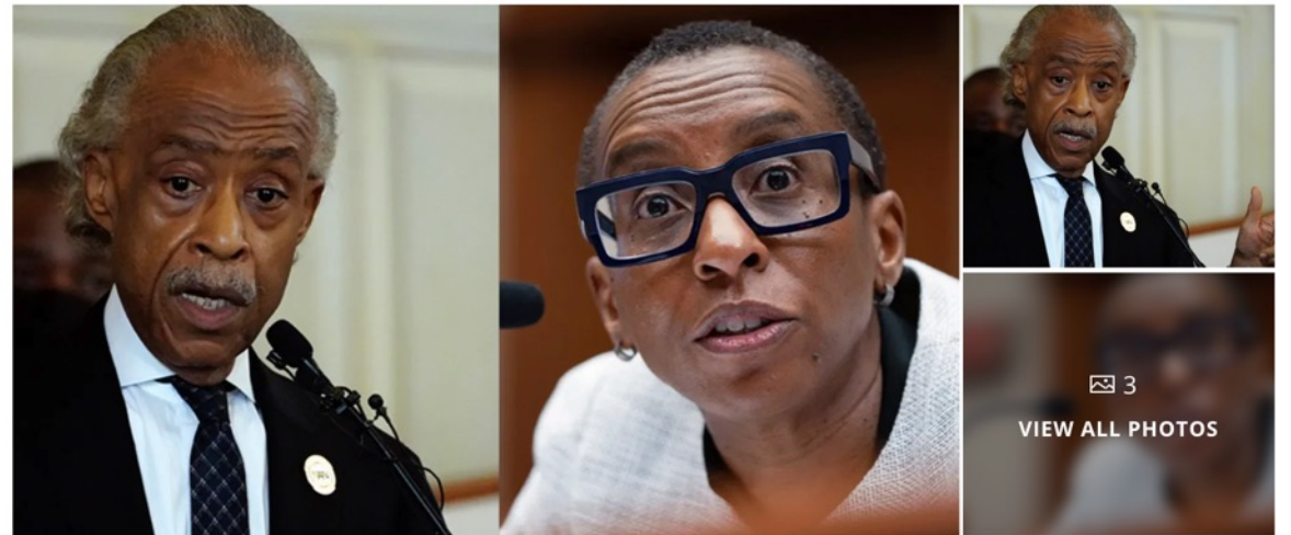
Rev. Al Sharpton and Claudine Gay