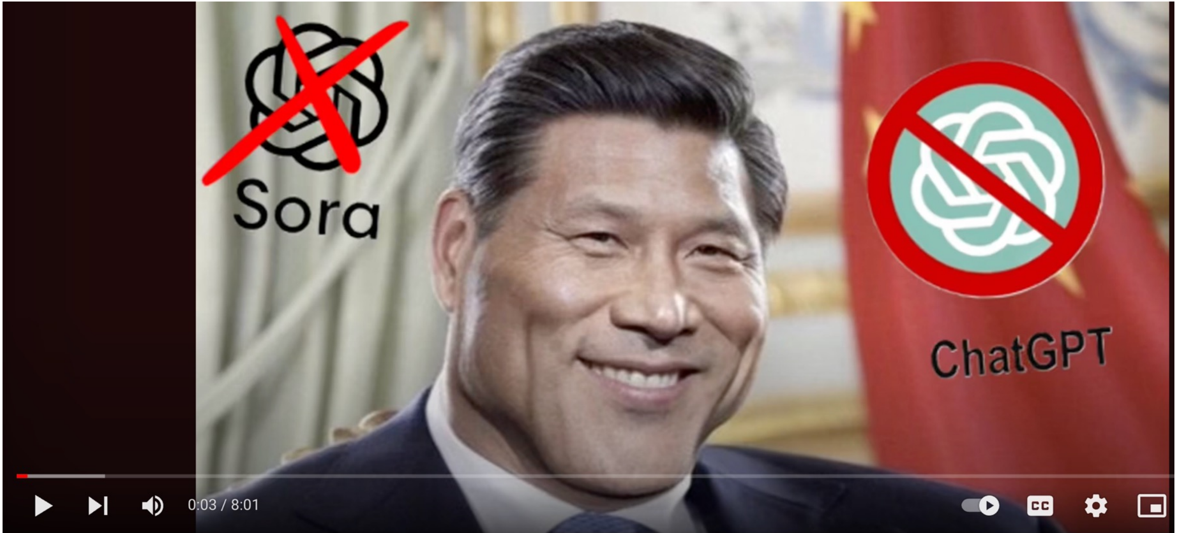
OpenAI Sora's biggest rival is here: Chinese AI model Kling creates videos with more accuracy